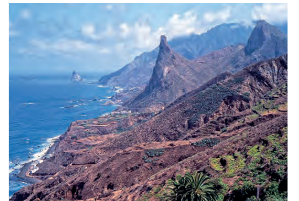
Exotisch schön: das Orotava-Tal auf der kanarischen Insel Teneriffa