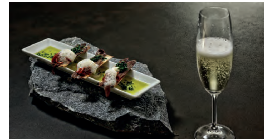
oben: Pflichtprogramm für Foodies: die verschiedenen Pintxos-Varianten