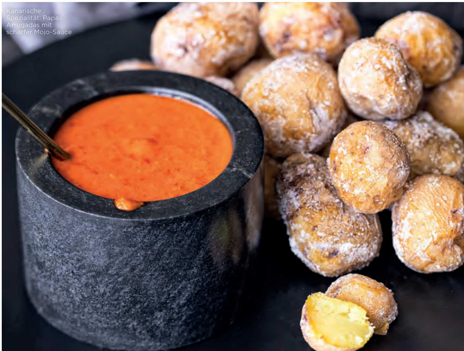
Kanarische Spezialität: Papas Arrugadas mit scharfer Mojo-Sauce

auf der Reise zwischen Lleida, Tarragona und Girona an unverwechselbaren „Mar i Muntanya“-Gerichten wie Huhn mit Languste (idealerweise mit der lokalen, fettarmen und saftigen Hühnerrasse Pollo del Prat und fangfrischem Seafood) oder Tintenfisch mit Fleischbällchen erfreuen. Liebhaber von hochwertigen eingelegten oder gerösteten Spezialitäten wie Anchovis, Calçots (gegrillte Lauchzwiebeln) oder Escalivada kommen hier genauso auf ihre Kosten.