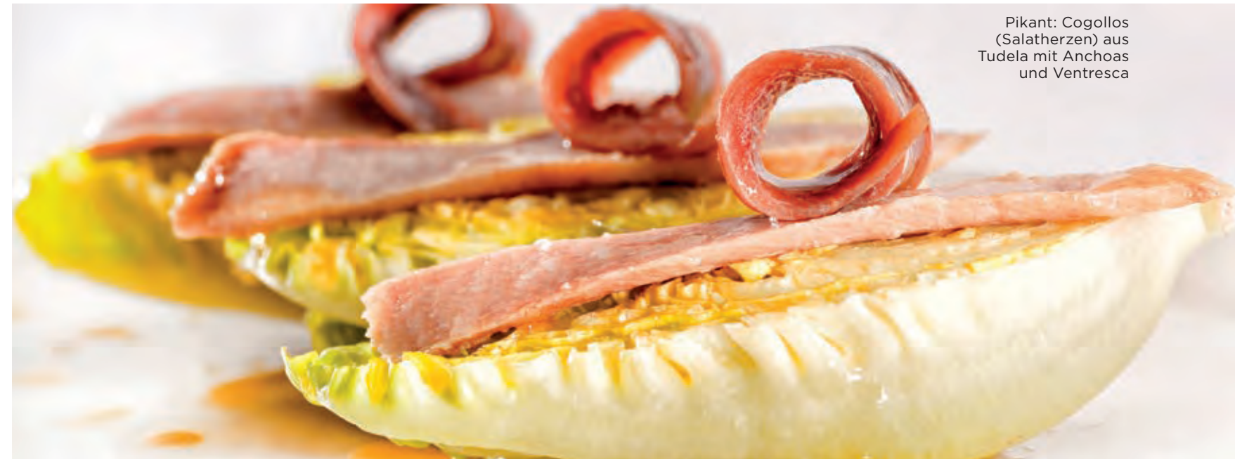
Pikant: Cogollos (Salatherzen) aus Tudela mit Anchoas und Ventresca

links: Seafood-Fans kommen im Baskenland auf ihre Kosten