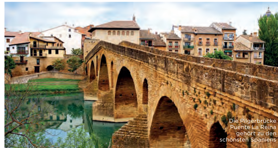
Die Pilgerbrücke Puente La Reina gehört zu den schönsten Spaniens