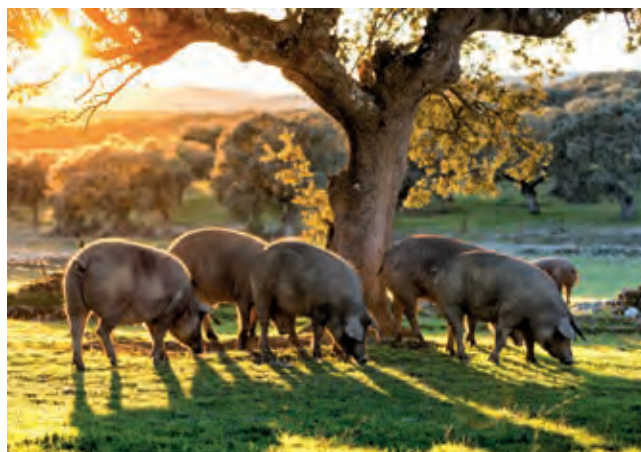
Ideale Futterbedingungen finden Iberico-Schweine in der Extremadura