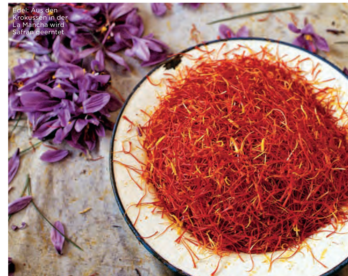
Edel: Aus den Krokussen in der La Mancha wird Safran geerntet

westen ein drittes Anbaugebiet hoch in die Berge hinein und macht das Garnacha-Dreieck in Gredos komplett.