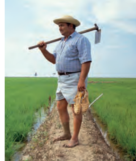
Am Rande der Albufera-Lagune in der Levante werden Rundkorn-Reissorten gezogen