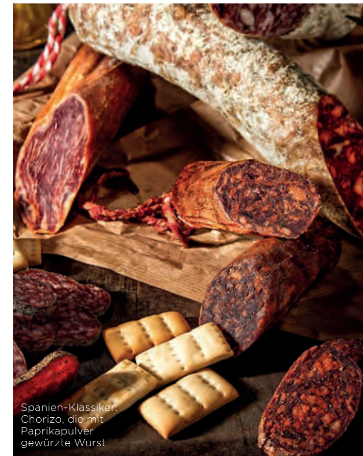
Spanien-Klassiker: Chorizo, die mit Paprikapulver gewürzte Wurst