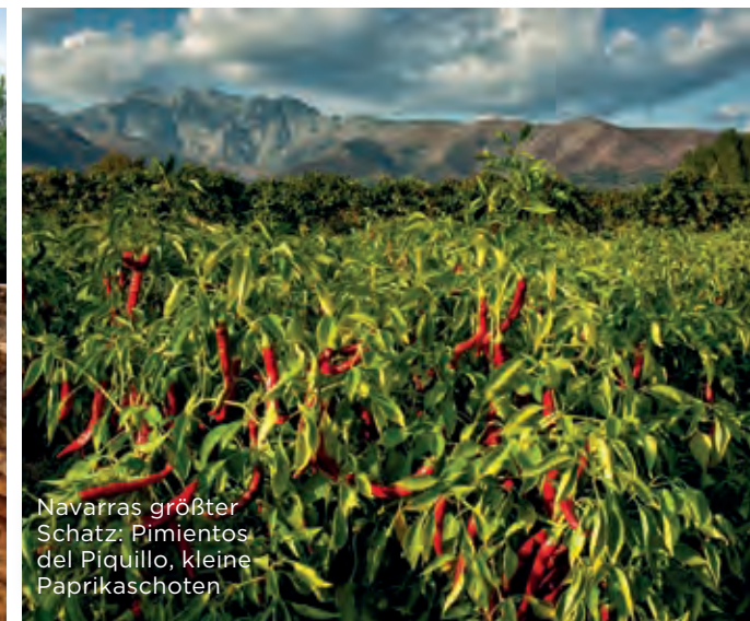
Navarras größter Schatz: Pimientos del Piquillo, kleine Paprikaschoten