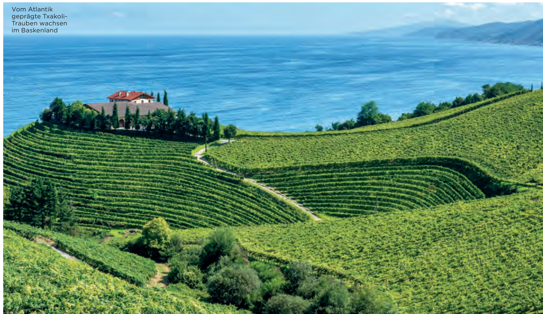
Vom Atlantik geprägte Txakoli-Trauben wachsen im Baskenland

Im Zentrum der grünen Nordküste des Landes haben einige dynamische Winzer begonnen, höchst spannende und individuelle Weine aus lokalen Sorten erzeugen. Dabei sind das Klima und die Lagen prädestiniert für eine atlantisch-