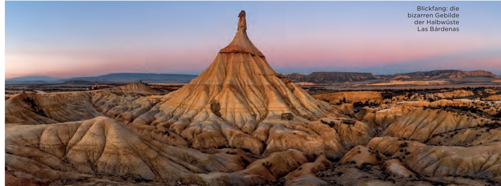
Blickfang: die bizarren Gebilde der Halbwüste Las Bardenas