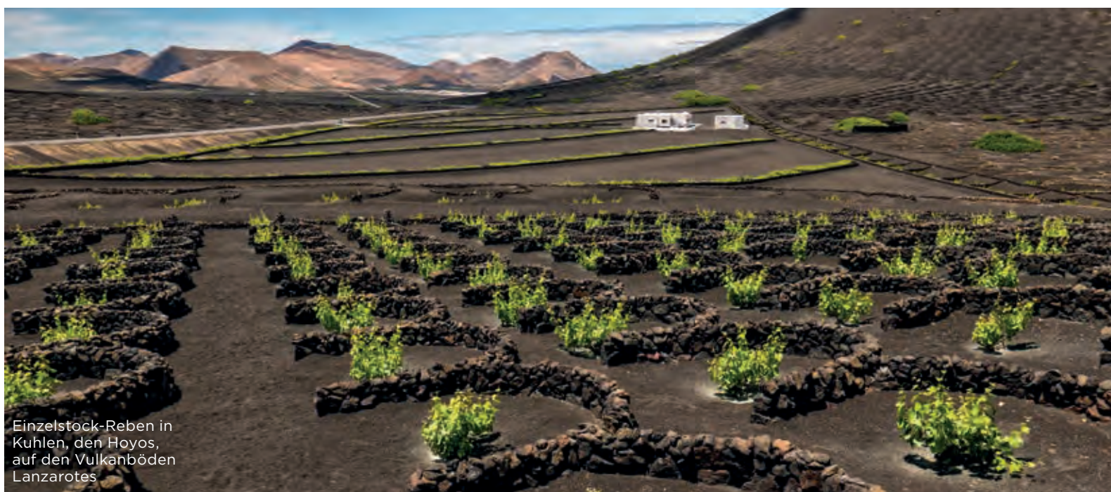
Einzelstock-Reben in Kühlen, den Hoyos, auf den Vulkanböden Lanzarotes

Das Iberische Scheidegebirge, in seinem westlicheren Verlauf Gredos genannt, ist heute Ort der Sehnsucht für Garnacha-Fans. Die große spanische Rotwein-Traube hat in den Hochtälern und an den Flanken des von gezackten Gipfeln geprägten Gebirgszugs einen dünnheutigen Klon entwickelt, der inzwischen weltweit gesuchte Gewächse hervorbringt. Früher war das Gredos-Massiv ein begehrtes Jagdgebiet und hat in Ermangelung standesgemäßer Unterkünfte für das jagdbegeisterte Königshaus schließlich den ersten Parador Spaniens hervorgebracht. Heute reichen drei Appellationen bis tief in die Sierra hinein. Die DOP Cebreros auf der kastilischen Seite aber auch der gegenüberliegende Bereich San Martín de Valdeiglesias der Hauptstadt-Appellation Vinos de Madrid weisen in ihren Katasterunterlagen Weinberge über 1 200 Meter über dem Meeresspiegel auf. Mit Méntrida zieht sich von Süd-