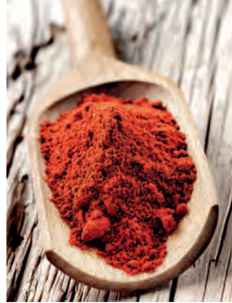
oben: Scharfes Gewürz: Pimentón de la Vera, gemahlenes Pulver der Gewürzpaprika

In einer der traditionsreichsten Wein- und Food-Hochburgen Spaniens herrscht momentan die vielleicht landesweit größte Dynamik. Die Heimat des Sherry im Nordwesten der Provinz Cádiz vereint feinste Sandstrände, beeindruckende historische Bauwerke, Flamenco und eine facettenreiche Gastronomieszene mit authentischen regionalen Speisen – und natürlich unzähligen quirligen Sherry-Bars. Das Sherry-Dreieck zwischen Sanlúcar de Barrameda, Jerez als zentraler Hauptstadt und El Puerto de Santa María im Süden beheimatet gut 1700 Winzer und fast 70 Bodegas, von kleinen Boutique-Betrieben bis hin zu den Schwergewichten der internationalen Weinbranche. Die besagte Aufbruchstimmung vollzieht sich interessanterweise jedoch weniger im Bereich der bekanntesten und klassischen, aufgespritzten Weinstile (die sogenannten Generosos) von Fino über Oloroso und Palo Cortado bis zu den konzentrierten, süßen Pedro Ximénez. Auch Andalusien hat einen Weg gefunden, seinen Weinen mehr Frische, Lebendigkeit, Spannung