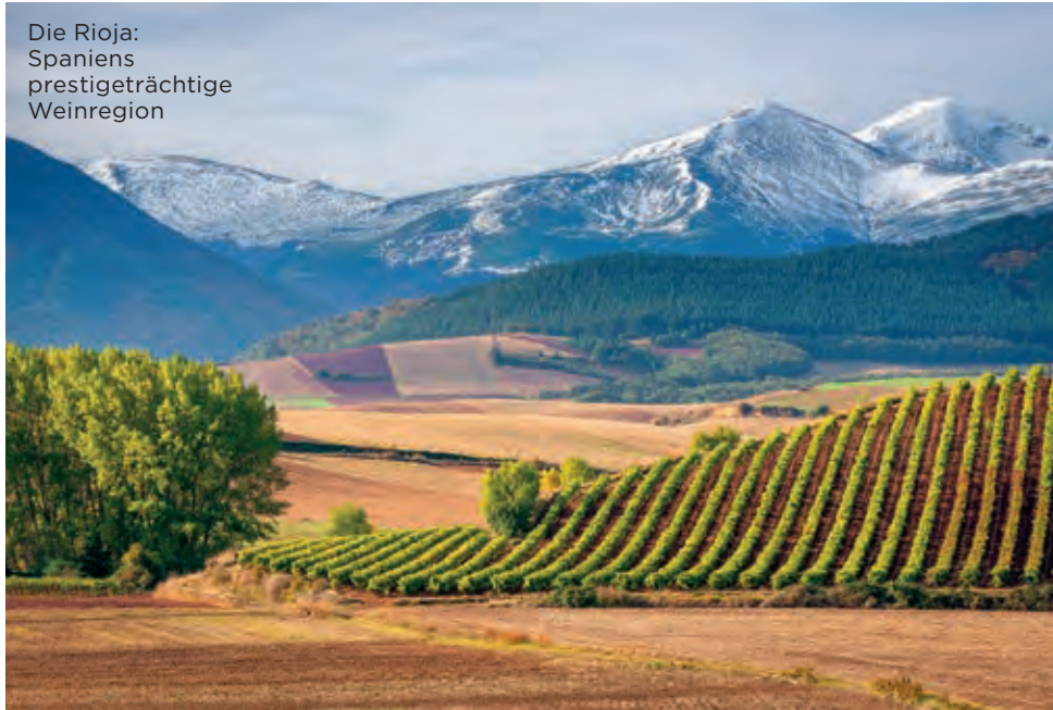
Die Rioja: Spaniens prestigeträchtige Weinregion

Auch wenn die Rioja größere Teile des Ebro-Flusses für sich in Beschlag nimmt, beeinflusst er auch das Nachbargebiet Navarra. Ohne diese wichtige Lebensader wäre qualitativ hochwertige Landwirtschaft zumindest unterhalb des südlichen Ufers nur ein Wunschtraum für die