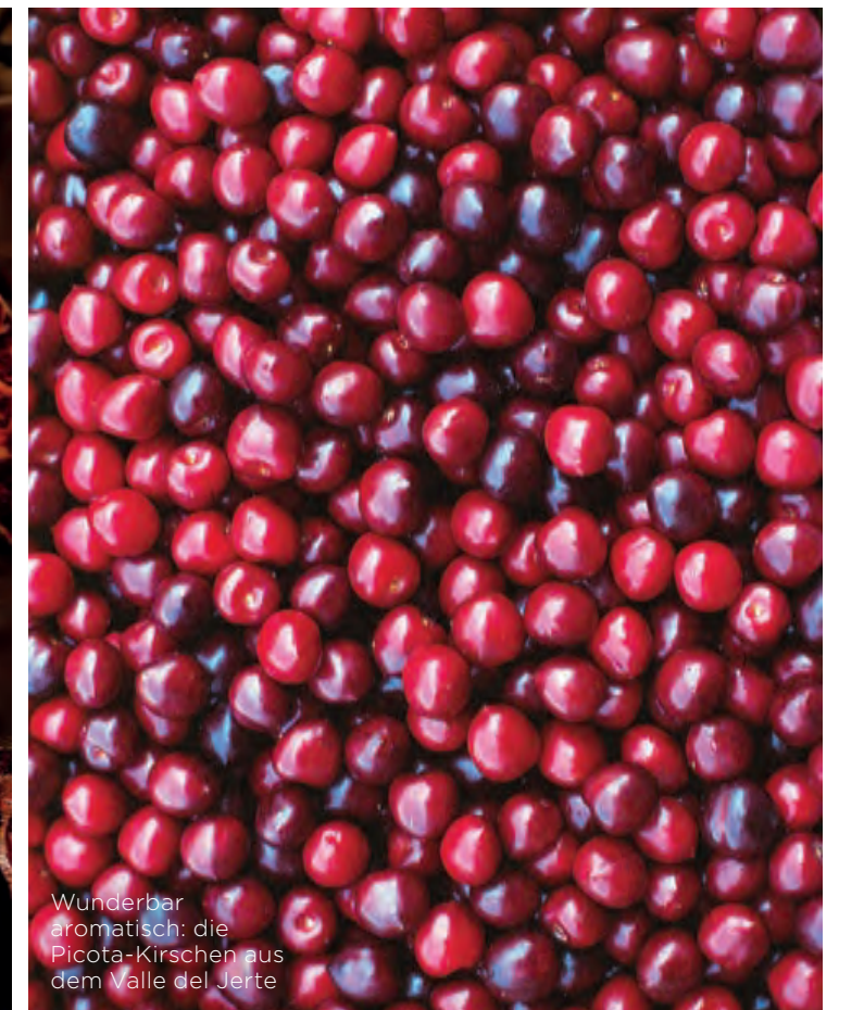
Wunderbar aromatisch: die Picota-Kirschen aus dem Valle del Jerte